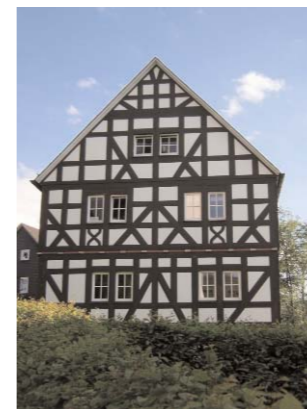
Was stimmt hier nicht?

Vergleichen Sie während der 2,5-stündigen Entdeckungstour die Fotos aus Ihrem Buch mit der Wirklichkeit, und finden Sie heraus, wo der Daadener Fehlerteufel dem Fotografen ins Handwerk gepfuscht hat.