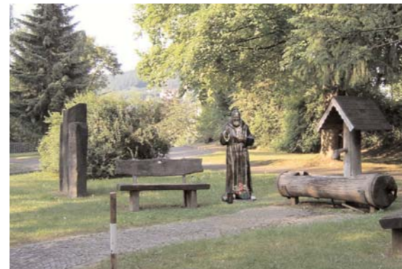
Was gehört nicht hierher?

Eine spannende Jagd quer durch den Ort auf den Spuren des Daadener Fehlerteufels!