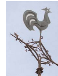
Was hier nicht in Ordnung ist, wissen alle, die den Spitznamen der Daadener kennen.

Dort erfolgt dann die Auswertung. Erfolgreiche Fehlersucher werden mit einer tollen Überraschung belohnt!