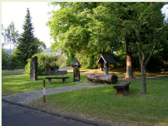
Was gehört nicht hierher?

Eine spannende Jagd quer durch den Ort auf den Spuren des Daadener Fehlerteufels!