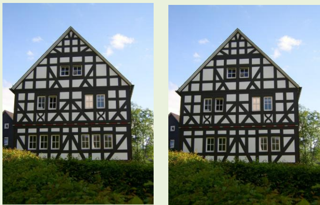
Was stimmt hier nicht?

Die „Ausrüstung“ erhalten Sie (gegen Pfand) in Leos Café, Betzdorfer Straße 11. Ausgestattet mit einem dicken Fotobuch, einer „Schatzkarte“ und Ihrem Aufgabenblatt erkunden Sie Daaden und lernen dabei seine schönsten Schätze kennen. (Ideal ist eine Gruppenstärke von 3 Personen, sodass jeder für einen Ausrüstungsgegenstand zuständig ist.)